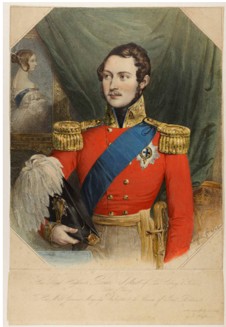
Franz Hanfstaengl, Albert und Victoria, Lithografie, 1840

Mit der Kabinettsausstellung zum 200-jährigen Geburtstag des englischen Königspaares wird an die engen Beziehungen zwischen England und Gotha erinnert, die bereits im 18. Jahrhundert ihren Anfang nahmen. Anhand von Porträts und Ansichten aus der grafischen Sammlung wird sowohl Dynastiegeschichte erzählt als auch der kulturelle Transfer zwischen den Höfen thematisiert.